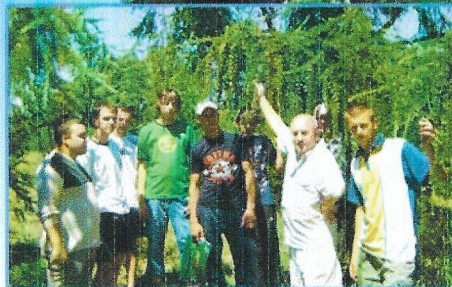
Навчальна практика студентів із предметів «Лісова селекція» та «Лісова таксація»