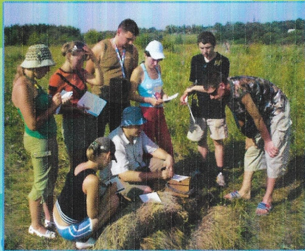
Літня практика студентів з предмету «Грунтознавство» на Харківщині