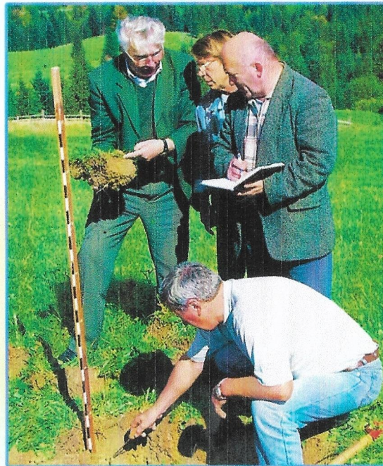
Дискусія про генезис ґрунтів Карпат з ґрунтознавцями Національного університету біоресурсів та природокористування України м.Київ

Прикарпатський національний університет імені Василя Стефаника Факультет природничих наук