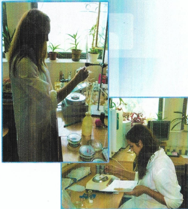
Визначення агрохімічних показників в лабораторії фізики та хімії ґрунту